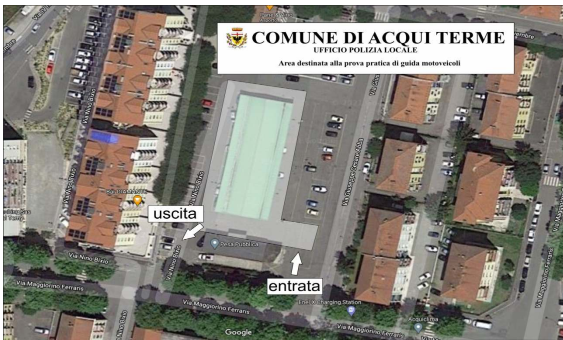
Figura 7. veduta dall'alto area concorsuale prova di agilità con la moto

I candidati dovranno presenti adeguatamente vestiti, OBBLIGATORIAMENTE, A PENA DI ESCLUSIONE MUNITI DI CASCO PROPRIO e se ritengono potranno altre proprie dotazioni non obbligatorie per l'espletamento della prova (guanti, giubbotto, para schiena, ecc.).