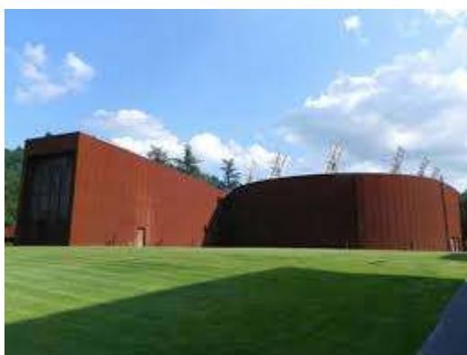
Figura 1 – Centro Congressi di Acqui Terme veduta esterna