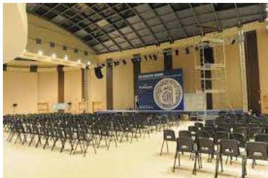
Figura 2 – Centro Congressi di Acqui Terme veduta interna

Le aree interessate sono chiaramente evidenziate nella sottoindicata planimetria.